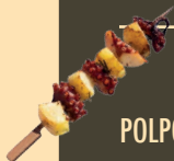
POLPO E PATATE