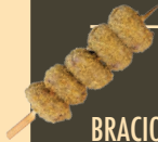
BRACIOLE DI VITELLO 5 PZ