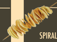
SPIRALE DI PATATE CRISPY